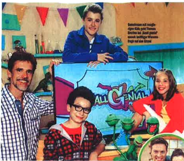
Gemeinsam mit richtigen Kids geht Thomas Brezina bei 'Knall genial' wöchentlich Wissens-Spaß auf den Grund

Mitmachen, Mitspielen und Mitreden! ist ab sofort das offizielle Motto bei Hallo okidoki. Konkret bedeutet das: Es gibt wieder alle beliebten Formate wie Kasperl, Helmi, AIDC-Bär, Schmatz, Tom Turbo und natürlich den frischen Franz