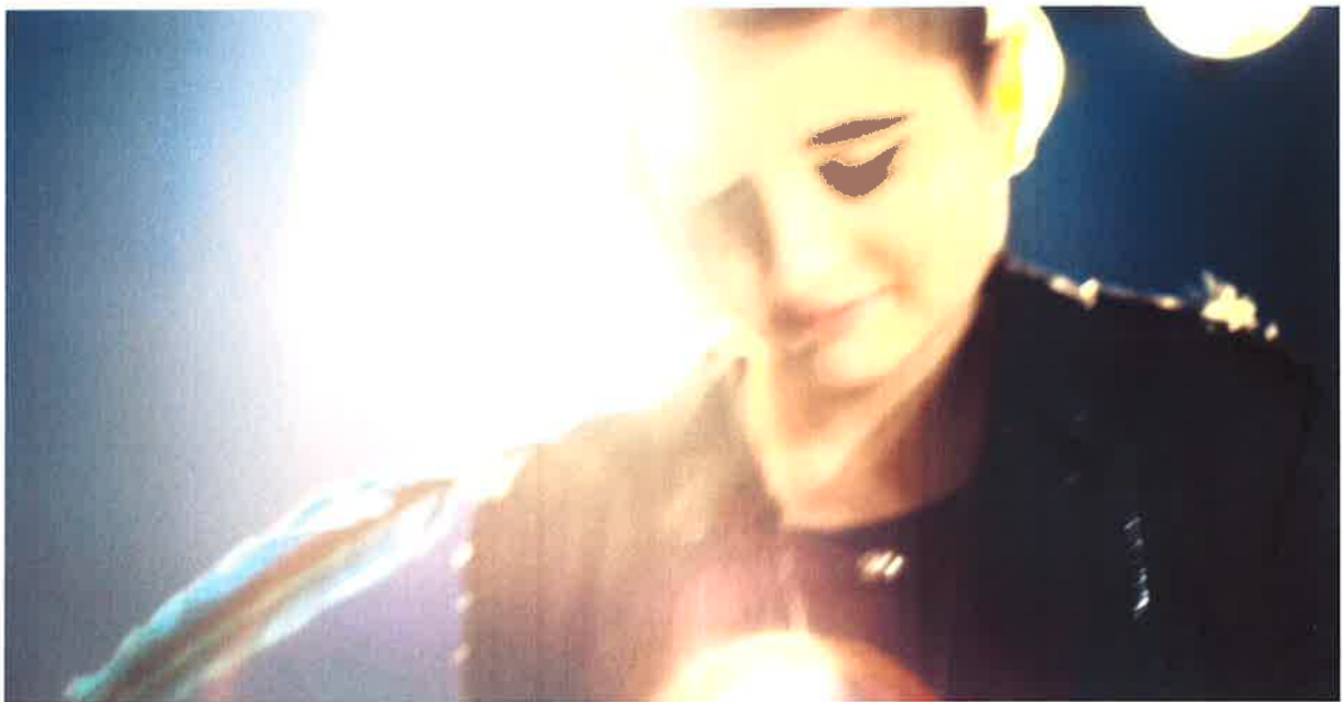
Video-Dreh November 2014 („you're lonesome“)