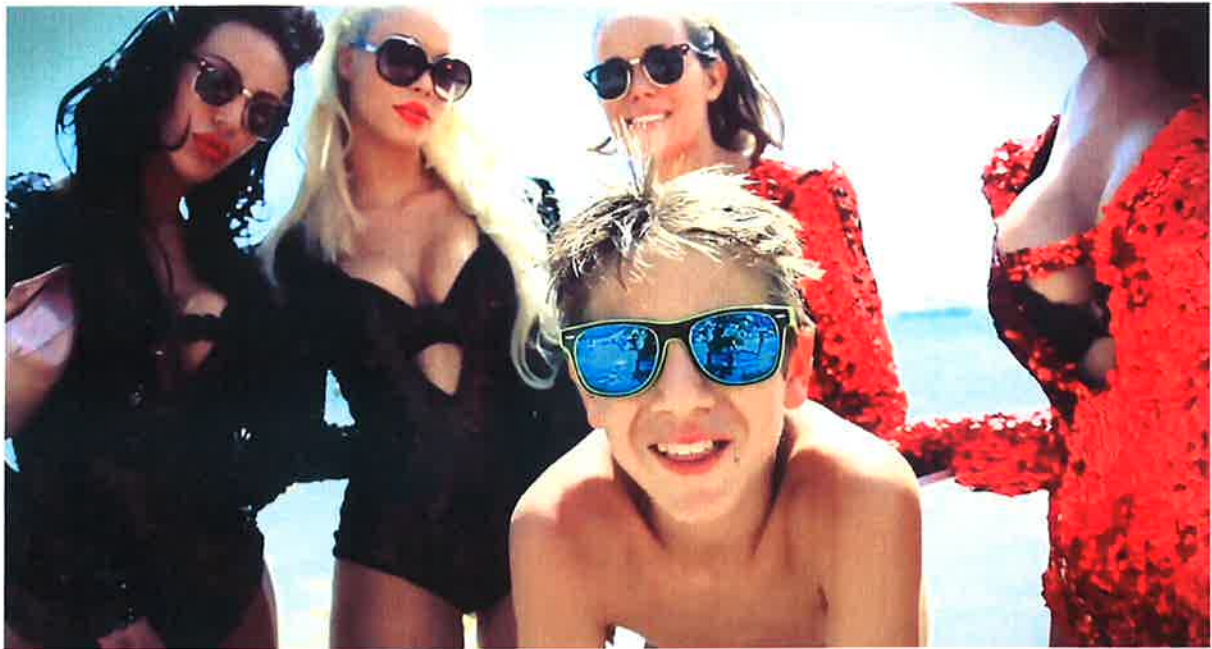
Video-Dreh Juli 2014 („sunday morning“)